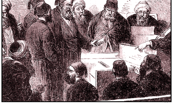
Resim 2.5: 1876 Yılında Kasımpaşa’da Birinci Seçmen Seçimi 32

b) Heyet-i Mebusan .- Heyet-i Mebusan üyeleri ise Osmanlı tebaasından her ellibin erkek nüfusa bir temsilci seçilmesiyle kurulur (m.65). Seçimler dört yılda bir kere yapılır (m.69). Seçimlerde “gizli oy ilkesi ( rey-i hafî kaidesi )” kabul edilmiştir (m.66). 28 Ekim 1876’da yürürlüğe konulan Talimat-ı Muvakkateye 31 göre, seçimler