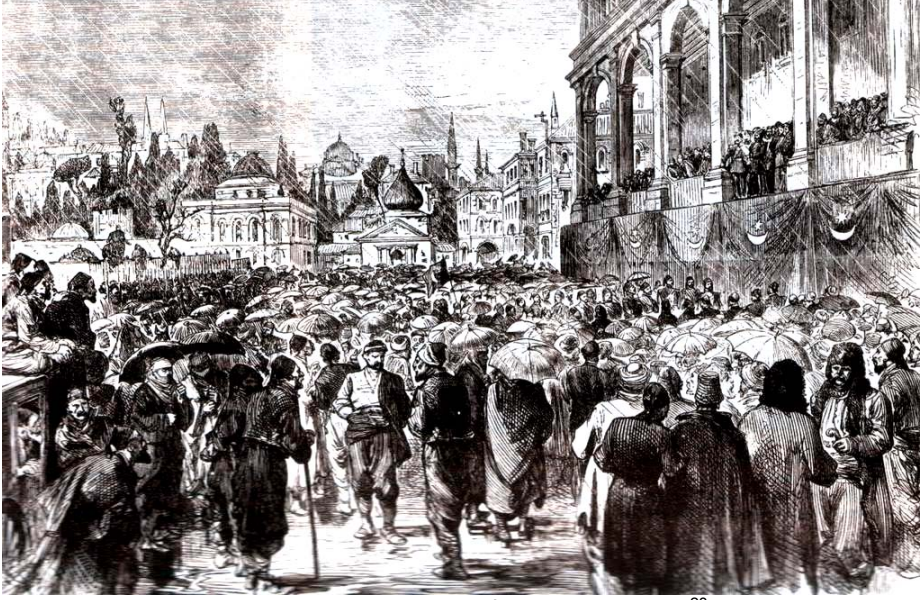
Resim 2.3: Kanun-u Esasînin İlânı (23 Aralık 1876) 28

dar etmiştir. Kanun-u Esasî, halkı temsil eden bir kurucu meclis tarafından hazırlanmamıştır. Keza Kanun-u Esasînin kabulü için bir kurucu referandum da yapılmamıştır. Kanun-u Esasî, hukukî olarak Padişahın tek yanlı bir işleminden doğmuştur. Kanun-u Esasî monokratik anayasa yapma usullerinden biri olan “ferman ( octroi )” usûlüyle yapılmıştır 27 .