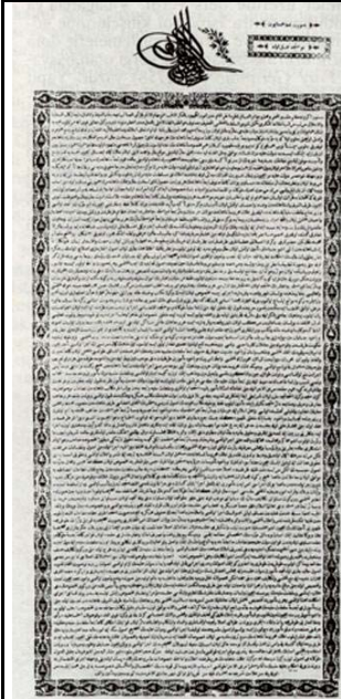
Resim 2.2: Islahat Fermanı 22

Islahat Fermanı, Kırım Harbinin son yıllarında hazırlanarak Paris Andlaşmasının imzalanmasından altı hafta önce, 28 Şubat 1856'da Bâb-ı Âlî'de bütün bakanlar, yüksek memurlar, şeyhülislâm, patrikler, hahambaşı ve cemaat ileri gelenleri önünde okunarak ilân edildi ve Paris Andlaşmasını hazırlayan devletlere bildirildi 20 . Kitaplarda Islahat Fermanının “dış baskı” sonucu çıkarıldığıнын yazılması âdettir. Kırım Harbinde, İngiltere, Fransa ve Avusturya Osmanlı İmparatorluğunu Rusya'ya karşı desteklemişti. 1856 Paris Konferansı öncesinde, Osmanlı İmparatorluğunu Rusya'nın müdahalelerine karşı korumanın bedeli ve Osmanlı İmparatorluğunun Avrupa Devletleri ailesine katılmasının şartı olarak Avrupa Devletleri birtakım şartlar ileri sürdüler. Bu şartlar Islahat Fermanının esasları olarak Ali Paşa ile İstanbul'daki İngiliz ve Fransız elçileri arasında kararlaştırıldı 21 . Islahat Fermanı da Tanzimat Fermanı gibi Pađışah Abdülmecit tarafından ısdar edilmiştir.