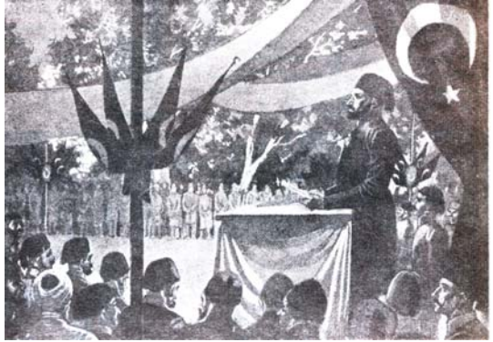
Resim 2.1: Tanzimat Fermanını Mustafa Reşit Paşa Gülhane’de Okuyor (3 Kasım 1839) 15

1839 yılında İkinci Mahmut’un ölmesinden sonra yerine Abdülmecit geçmiştir. Abdülmecit devletin kuruluşunu yeniden tanzim eden bir ferman ısdar etmiştir. Bu ferman 3 Kasım 1839’da Padişahın, yabancı elçilerin ve halkın huzurunda Gülhane’de fermanı yazan zamanın Dışişleri Bakanı Mustafa Reşit Paşa tarafından okunmuştur 14 . Bu nedenle Tanzimat Fermanına “Gülhane Hatt-ı Hümayunu” da denir.