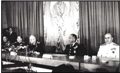
Fotoğraf 3.8: Millî Güvenlik Konseyi (Org. K. Evren ve Arkadaşları) 59

a) Millî Güvenlik Konseyi , 12 Eylül 1980 müdahalesini yapan Genelkurmay Başkanı Orgeneral Kenan Evren, Kara Kuvvetleri Komutanı Orgeneral Nurettin Ersin, Hava Kuvvetleri Komutanı Orgeneral Tahsin Şahinkaya, Deniz Kuvvetleri Komutanı Nejat Tümer ve Jandarma Genel Komutanı Orgeneral Sedat Celasun’dan oluşmuştur.